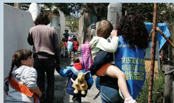
Evacuação da população da área de perigo de tsunami durante um exercício na Ilha de Stromboli (Itália), em 2005.