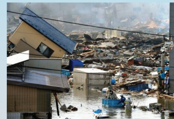
Muitas vezes os tsunamis deixam para trás água que fica estagnada e que contém resíduos perigosos. American Samoa, setembro de 2009.

SE RECONHECER ALGUM SINAL NATURAL DE TSUNAMI, DIRIJA-SE IMEDIATAMENTE PARA UM PONTO ALTO.