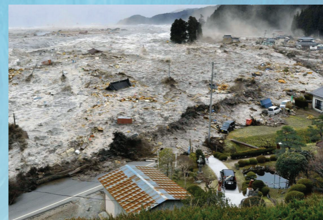
A chegada de um tsunami à cidade de Miyako, Iwate, Japão no dia 11 de março de 2011.

Um tsunami é uma série de ondas causadas pelo deslocamento súbito de um grande volume de água. Estas ondas podem chegar à costa em minutos, mas podem continuar por várias horas. Os tsunamis podem ser gerados por um grande sismo costeiro ou submarino longe da costa, deslizamentos de terra, erupções vulcânicas, perturbações da pressão atmosférica (meteo-tsunamis) ou impactos de grandes meteoritos. Portugal Continental pode ser afetado por várias fontes conhecidas que se encontram junto da sua costa. Mas existem também fontes distantes no Atlântico com possível impacto em Portugal Continental, Açores e Madeira. Os Açores, pela sua natureza vulcânica, podem ser afetados por tsunamis de carácter local. Outros países desta região estão igualmente expostos a tsunamis ao longo da costa do Atlântico (p.e., Espanha, Marrocos).