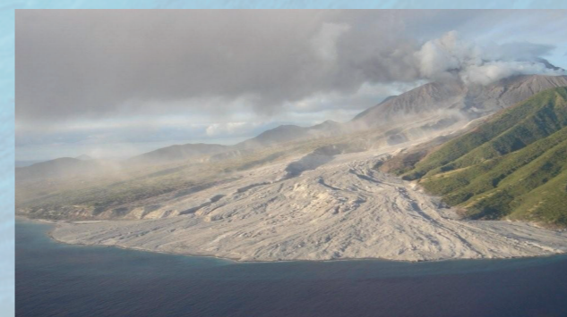
Avalanche de lama (mud flow) no Tar River Valley, Montserrat (Caraibas).